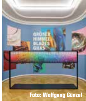
Unter allen Einsendungen des richtigen Lösungswortes ver-lösen wir 3x 2 Freikarten für die Ausstellung „Grüner Himmel, Blaues Gras“ im Weltkulturen Museum.